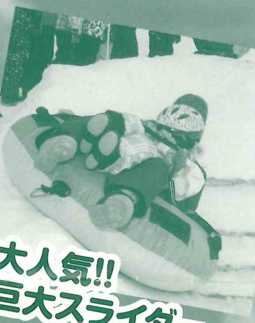
大人気!! 巨大スライダー